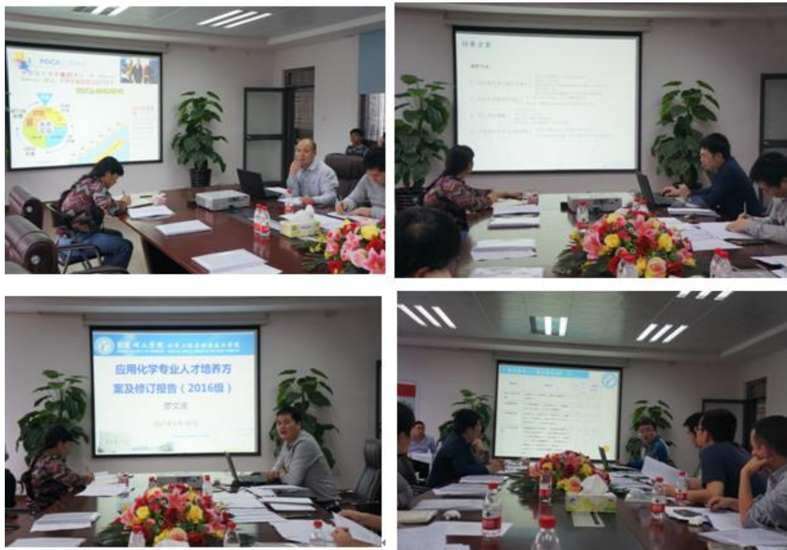
教育教学大讨论之人才培养方案制订及修订